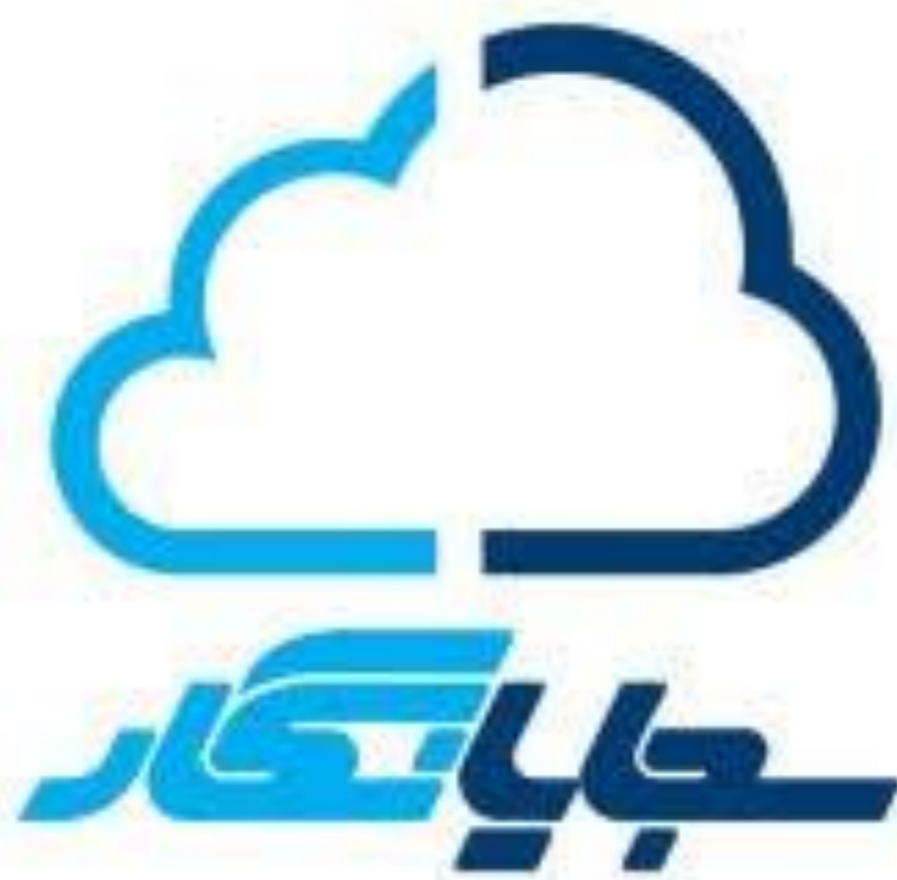
شکل ۱ لوگوی شرکت سجایانگار

دستیابی به یک الگوی رفتاری از مشتریان براساس داده‌های در دسترس فهم داده و مقدار همبستگی بین ویژگی‌ها دسته‌بندی مشتریان در چهار گروه اصلی ارائه پیشنهادات عملی برای هر گروه در جهت نگهداری از مشتریان به دست آوردن اطلاعات در مورد شاخص‌های کمی هر گروه از مشتریان و مصورسازی آن‌ها