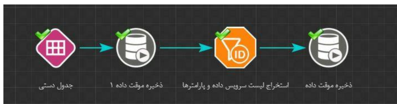
شکل ۲: یک نمونه فرآیند برای گزارش