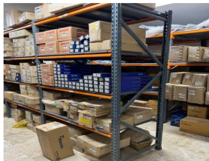
شکل ۲- انبار کالا