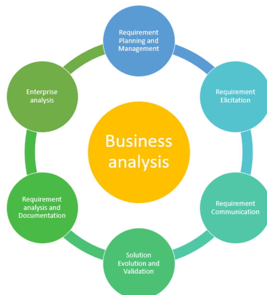
شکل ۲ قسمت های مختلف تحلیل کسب و کار