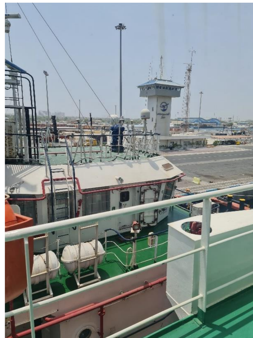
شکل ۱ برج مراقبت