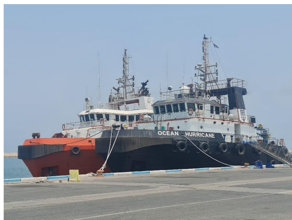
شکل ۲ پهلوگیری دوتایی کشتی‌ها به علت در دسترس نبودن جا - تصمیم بخش عملیات