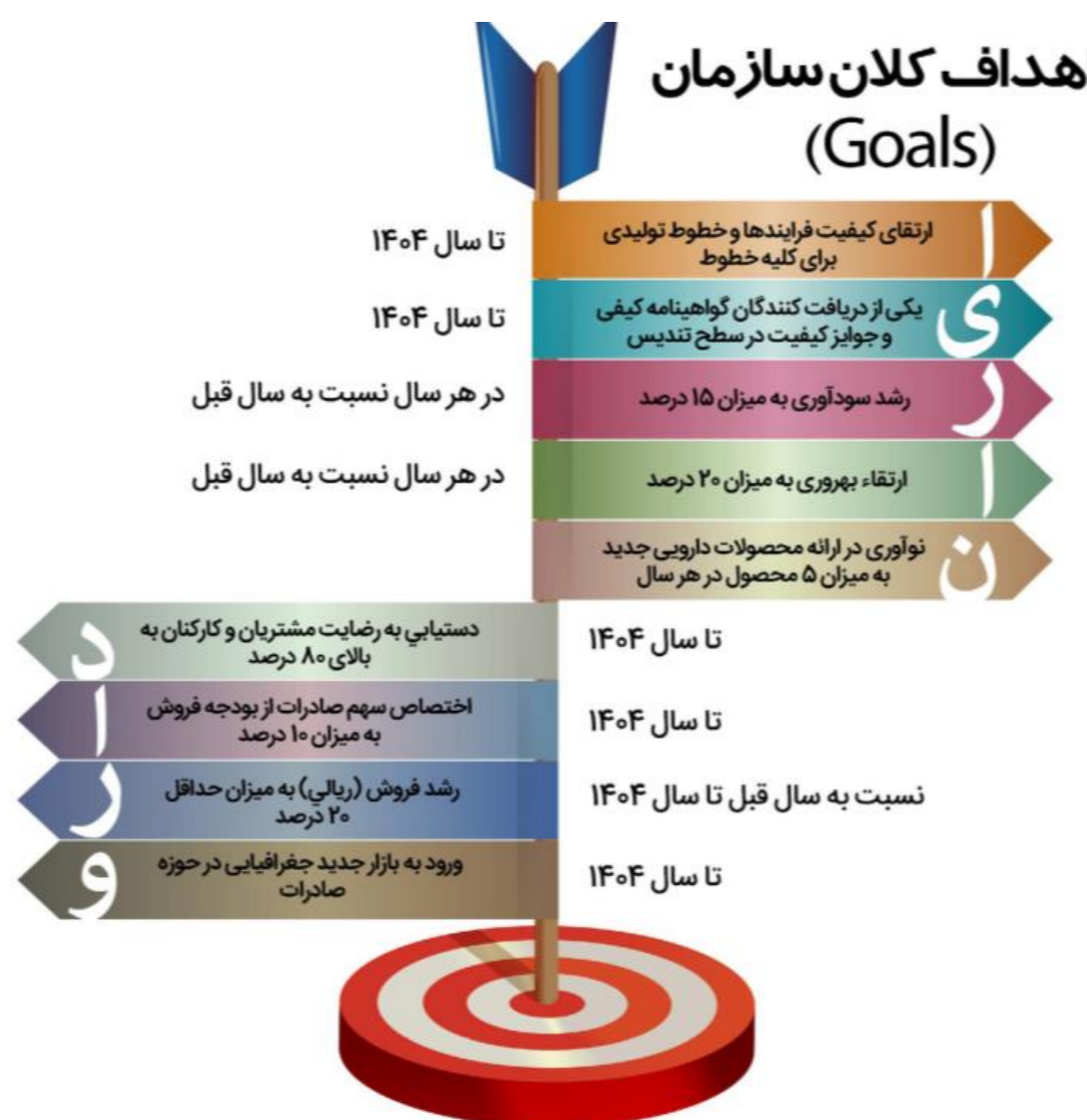
شکل ۳ اهداف کلان سازمانی شرکت