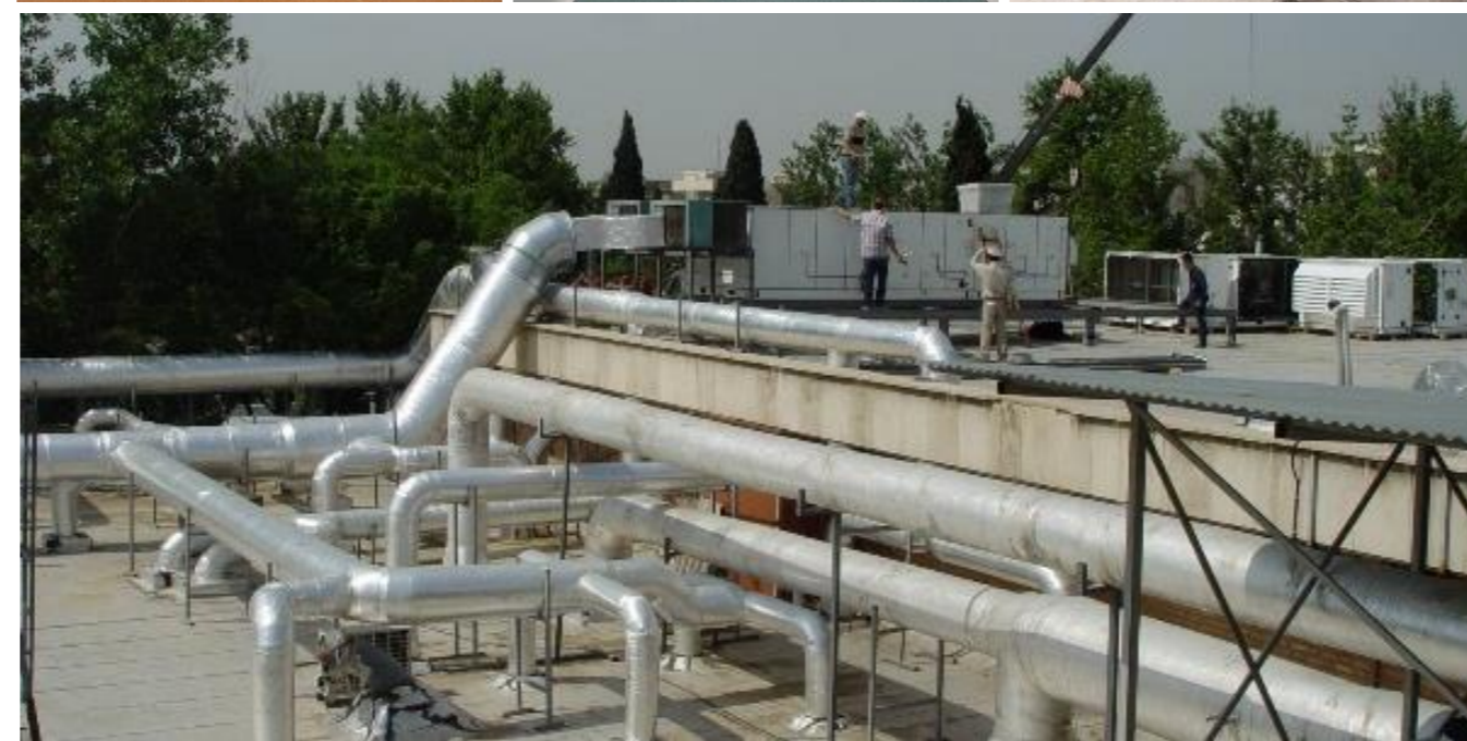
شکل ۲ نمای بیرون و بخش های داخلی واحد صنعتی