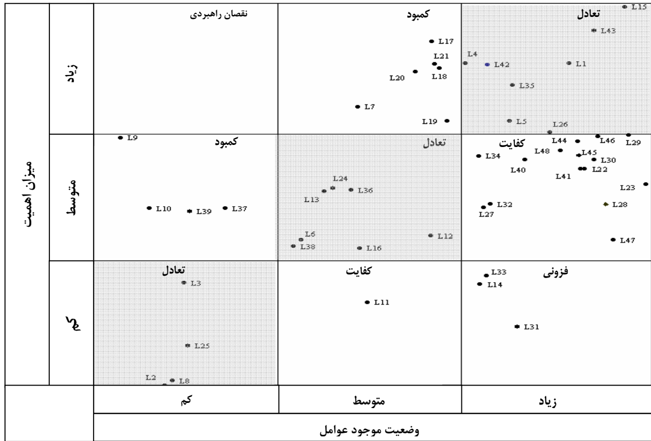
شکل ۱. ماتریس آسیب شناسی عناصر نابی در صنعت کاشی