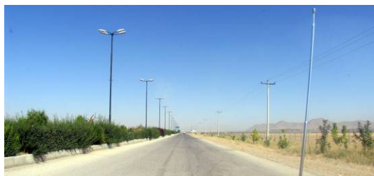
شکل ۳. کاهش ادراک جزئیات منظر در اثر افزایش سرعت حرکت، محور ورودی شهرکرد

لذا راننده بطور نسبی بسیار کمتر از عابر پیاده می‌تواند جزئیات منظر شهری را ادراک نماید [۳].