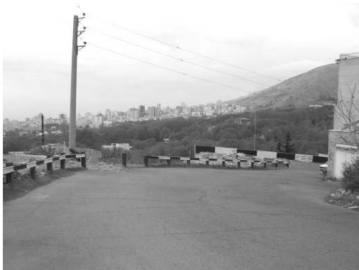
شکل ۵. تقویت دید و منظر توسط تغییر جهت و انحنای مسیر، محله باغ شاطر دربند، تهران