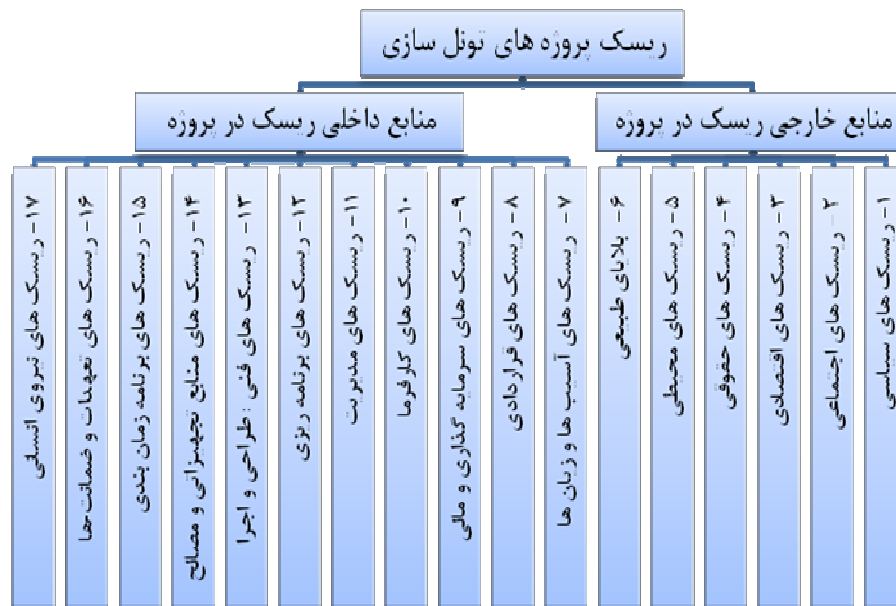
شکل ۱. ساختار شکست ریسک پروژه‌های تونل‌سازی (۱۷ ریسک اصلی)