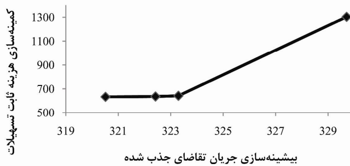
نمودار ۲. جواب‌های ناچیره مدل برنامه‌ریزی آرمانی وزن داده شده پیشنهادی

* نرم‌افزار پس از مدت ۳۶۰۰ ثانیه به جواب مذکور (با فاصله ۳/۳۷۱٪ از کران پایین محاسبه شده) رسید.