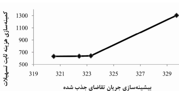
نمودار ۲. جواب‌های ناچیره مدل برنامه‌ریزی آرمانی وزن داده شده پیشنهادی

* نرم‌افزار پس از مدت ۳۶۰۰ ثانیه به جواب مذکور (با فاصله ۳/۳۷۱٪ از کران پایین محاسبه شده) رسید.